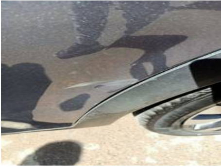
Porte arrière gauche (Rayure)